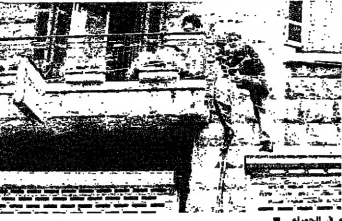
الحركة في الحمراء